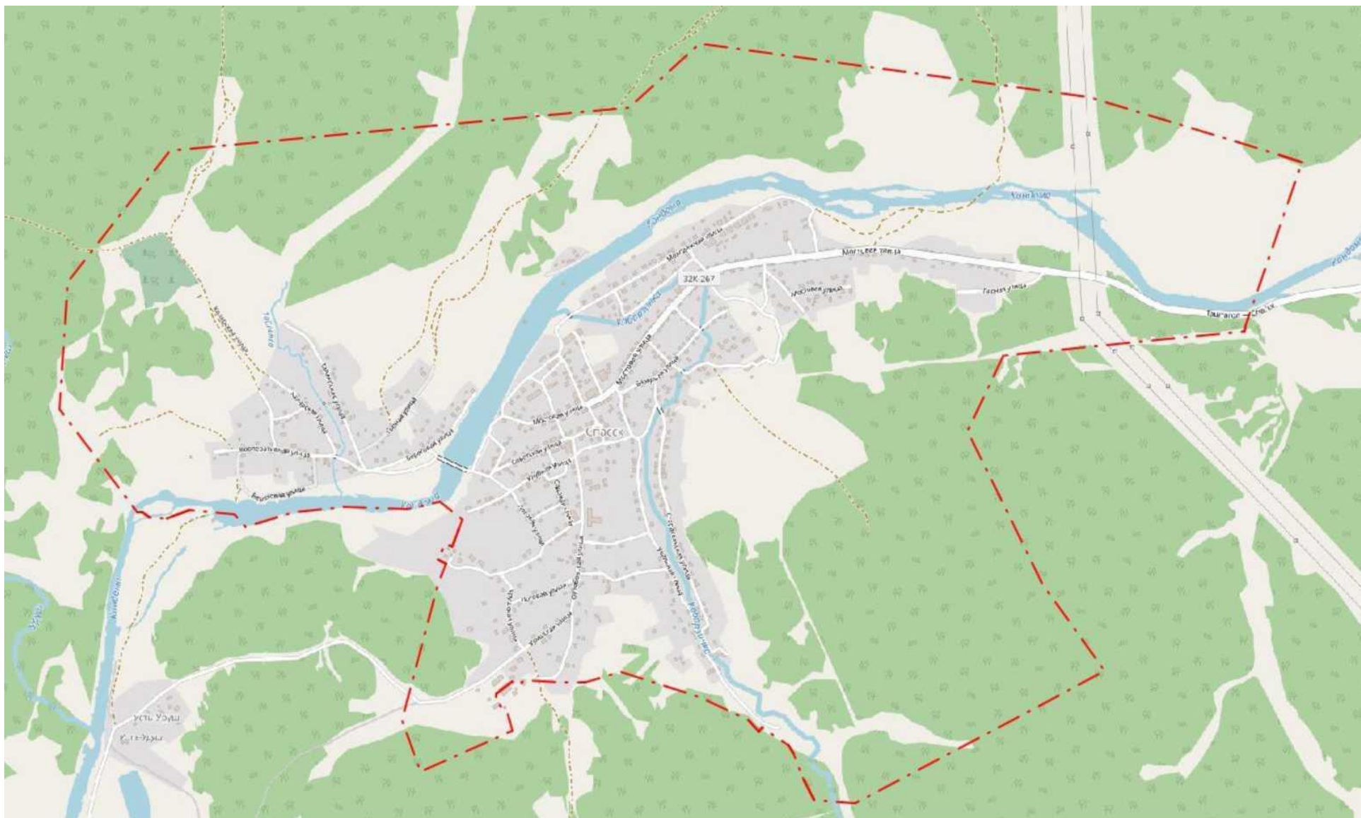
Рис. 1.1. Границы городского поселения