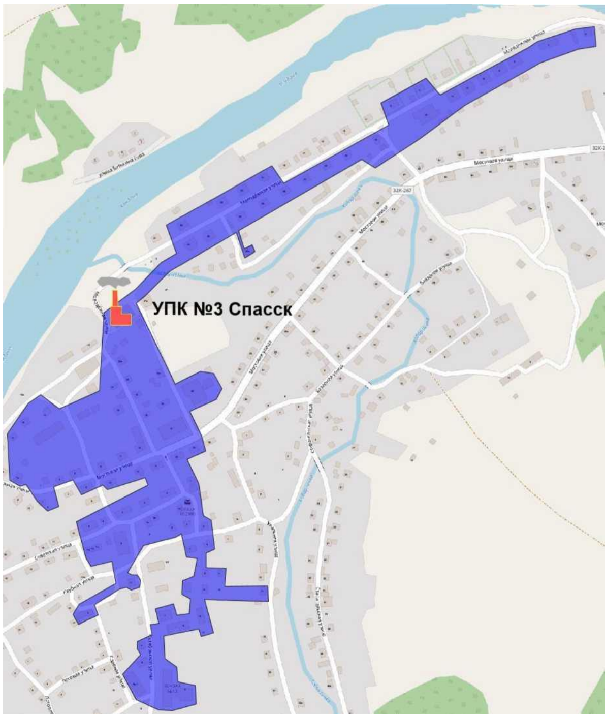
Рис. 2.1. Существующие зоны действия тепловых источников в городском поселении по состоянию на 2022 г.

Перспективная зона действия теплового источника городского поселения на 2036 г. представлена на рисунке 2.2.