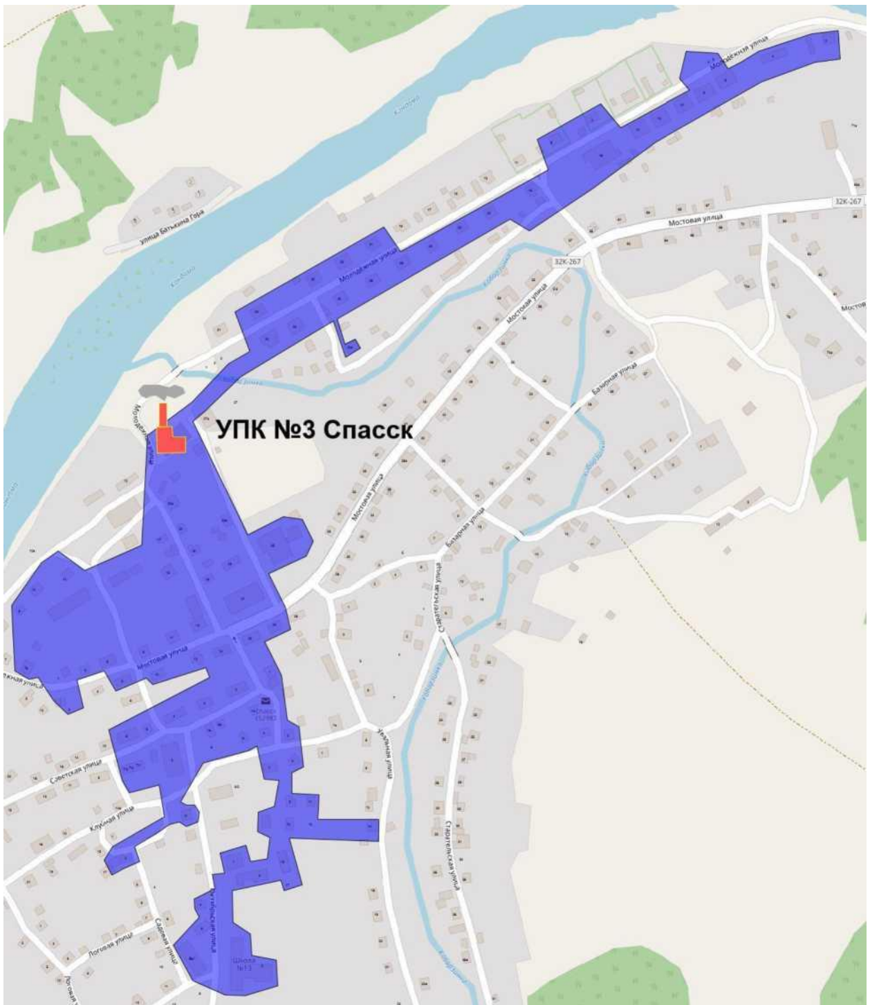
Рис. 2.2. Перспективные зоны действия тепловых источников в городском поселении по состоянию на 2036 г.